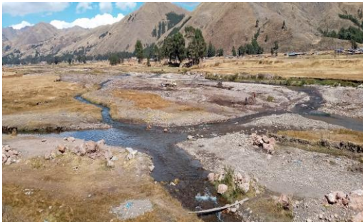
FOTO 03: Se aprecia el curso del agua margen izquierda, en época de estiaje con cauce colmatado, localizado en el sector comunidad Chauchapata y Sencca Chectuyoc del distrito de Sicuani.