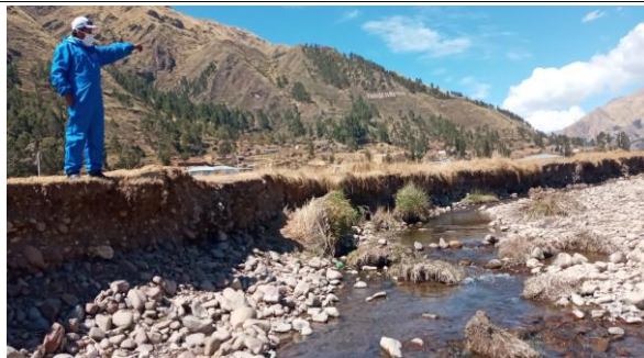
FOTO 01: Se aprecia el curso del agua del río Vilcanota las margenes derecha e izquierda se encuentran afectados por erosión y colapso por tramos, sin defensa riberaña talud natural, así mismo cauce colmatado. comunidad campesina de Chauchapata y Sencca Chectuyoc, Distrito de Sicuani.