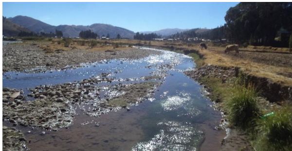
FOTO 04: Sección hidráulica variable, se aprecia en la ribera de la margen derecha aguas abajo COMUNIDAD CAMPESINA DE TRAPICHE, afectado la ribera margen derecha y cauce colmatado y se aprecia el canal de irrigación Trapiche.